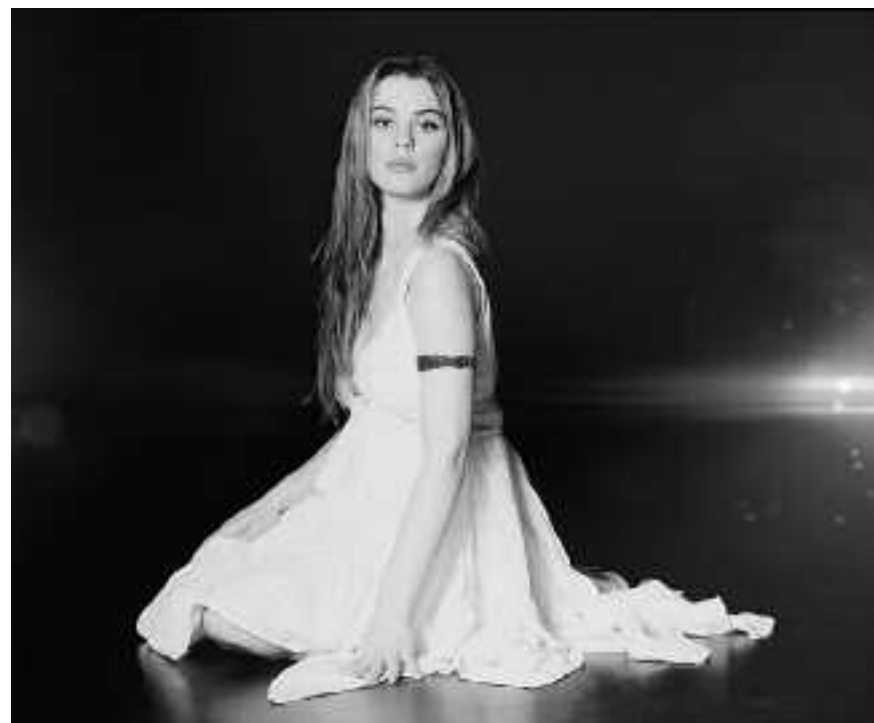
Emmelie de Forest vann European Song Contest. Är det sant som hon hävdade, att hon och fadern Ingvar de Forest i rakt nedstigande led härstammar från kung Edward VII av England?