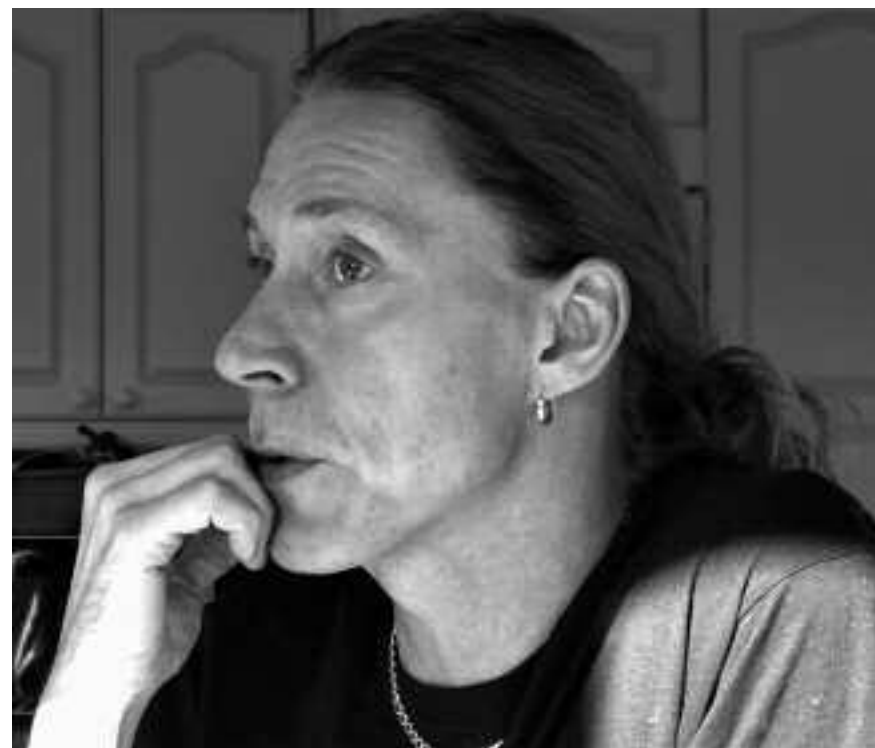
– Jag har slarvat med musiken det senaste halvåret och inte skrivit en låt på länge. Det har ju varit så mycket annat.

Han stöder nätverket "Hundar utan hem" och tar själv hand om hundar som farit illa. Just nu har han