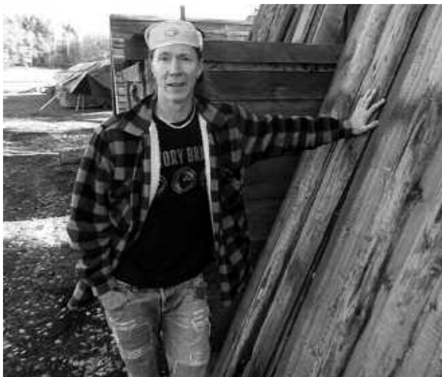
– Nästa år ska det bli höns, grisar och kor.