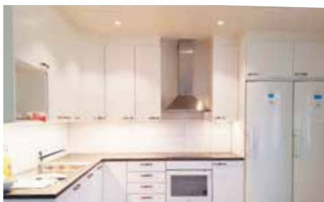
Lättskötta ytor och bra med förvaring i köken.

"Ett mycket välkommet bygge som stärker vår bygd så att förskola, skola, affären m.m. kan leva vidare." Ove Wallin (C), kommunalråd och ledamot i Ekerö Bostäder, i samband med invigningen 5 maj 2023.