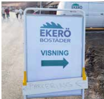
Ekerö Bostäder visade en lägenhet av varje storlek den 11 april. En 2:a, en 3:a och en 4:a.