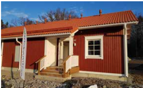
Allt är inte klart, en hel del markjobb återstår. Men inflyttning 1 juni blir det.