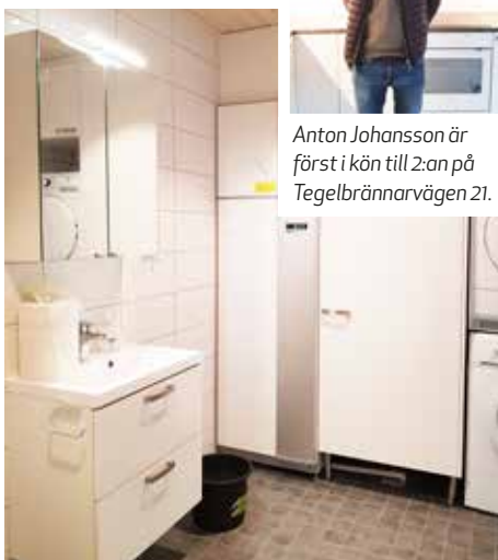
Härligt fräscha badrum.