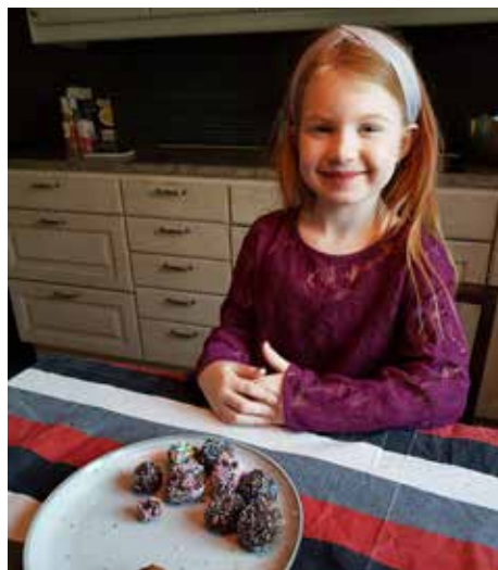
Ronja och de jättegodas chokladbollarna.

– Det vill jag gärna. Men mitt drömjobb är faktiskt polis. För det var tjuvar på Munsö för några veckor sen. Nära en kompis. Dom tog pengar och dyra smycken. Så nu är jag skräckrädd för att tjuvar ska komma hit. Jag har till och med drömt vad som kan hända.