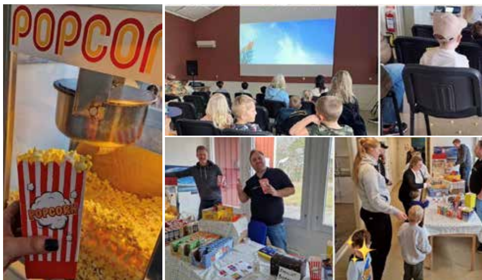
Collage från sportlovsbio i Hembygdsgården.