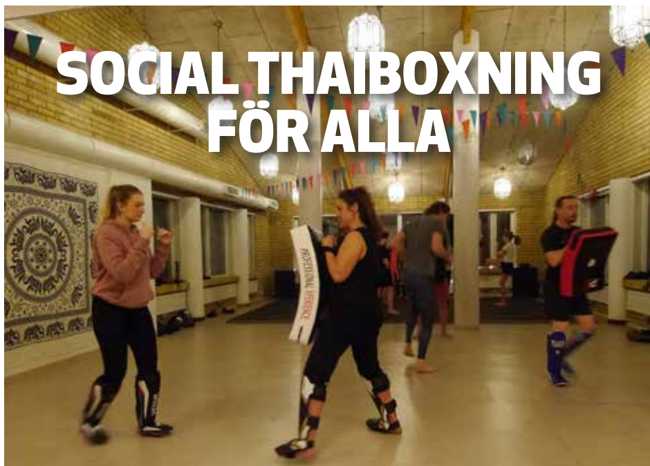
Träningslokal är den före detta matsalen i storköket på Sättra Gård.

Club Socials lite oregelbundna verksamhet i det gamla storköket livar upp området kring Herrgården på Sättra Gård.