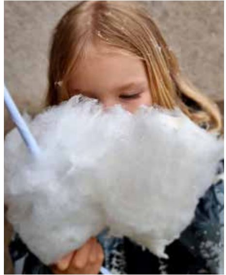
Mums, sockervadd!