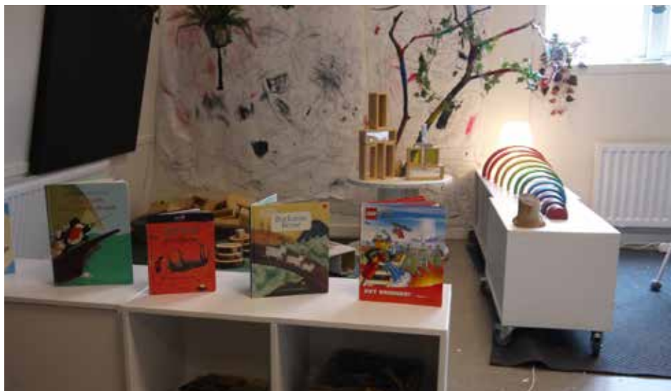
Flera stationer att välja bland för barnen på Adelsö förskola. Här lockas till läsning.

En kulen dag i slutet av mars får Adelsönytts reporter och fotograf förmånen att besöka nyrenoverade Adelsö förskola som nu har 25 inskrivna barn.