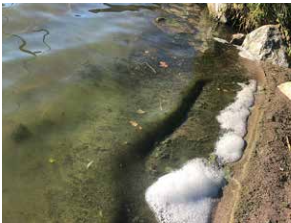
En grön algröra i strandkanten.

Man analyserar proverna med mikroskop och då kan man se om det är cyanobakterier som kan vara giftiga. Oftast hittar man sådana bakterier vid provtagningarna. Problemet är