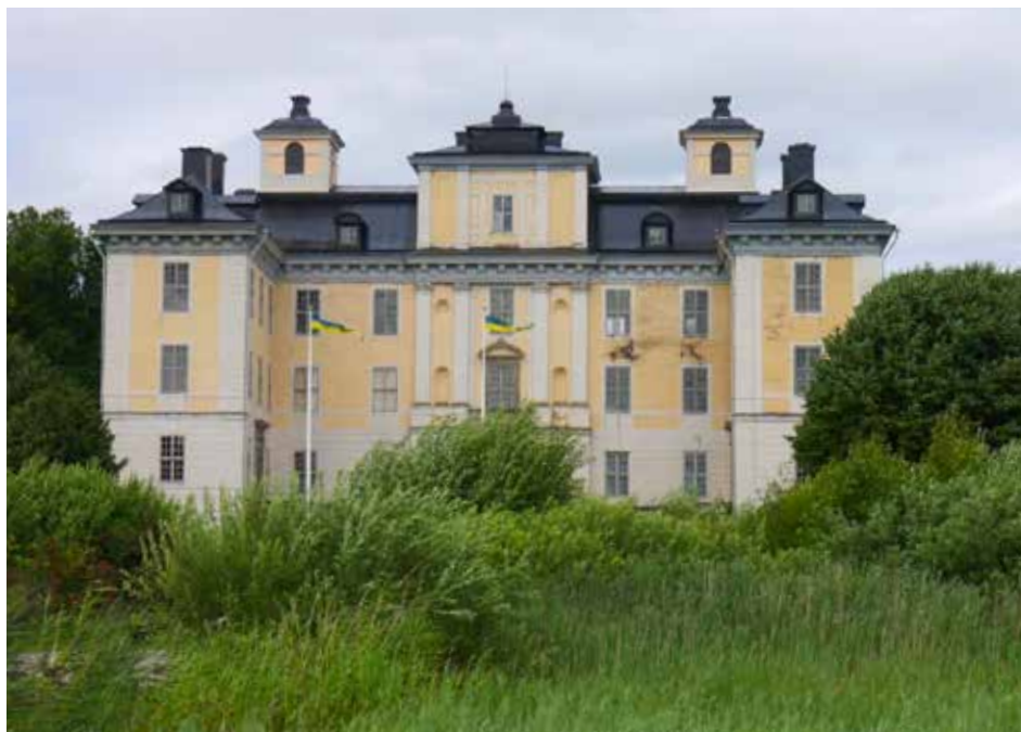
Mälsåkers slott.

För oss som rör oss på Mäläröarna, är det tydligt att vi befinner oss i en trakt som är välförsedd med slott och herrgårdar.