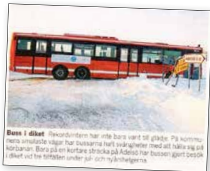
Buss i diket Rekordvintern har inte bara varit till glädje. På kommunens ämnlaste vägar har bussarna haft svårigheter med att hålla sig på körbanan. Båra på en kortare sträcka på Adelsö har bussen gjort besök i diket vid tre tillfällen under jul- och nyårsfesterna.