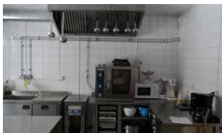
Drämköket i Adelsö förskola.

I samband med renoveringen tog man bort en förbindelseörr mellan hembygdsgården och förskolan. Förskolan fick då en egen entré. De kan dock fortfarande gå till bibliotekshörnan i Hovgårdens informationscenter och låna böcker. Och har även i övrigt ett jättebra samarbete med biblioteket.