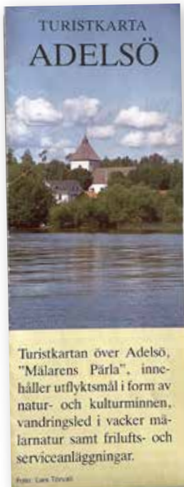
Turistkarta anno 1994.

I väntan på den nya kartan finns ju digitalalternativen på www.adelso.se eller www.naturkartan.se (där du även hittar den uppskattade appen Naturkartan). ■