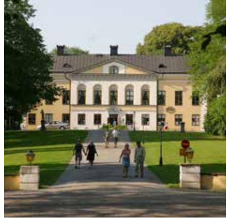
Taxinge Slott, "Kakslottet".

Mälsåkers slott som började byggas redan i slutet av 1500-talet har en spännande historia också under modern tid.