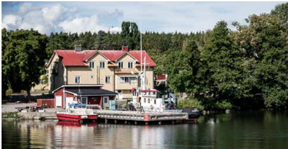
Kurö by från fjärden.

Efter ett antal månaders försäljningsansträngningar såldes Kurön i slutet på mars. Köpare är företaget Little Afognak AB.