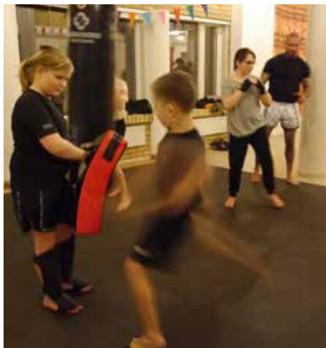
Fullt ös på barnavdelningen.