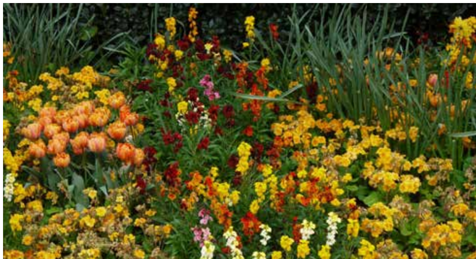
Bättre vattna dem med sjövattnen.