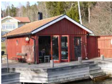
Båthuset blev bastu. I bakgrunden syns boningshuset.