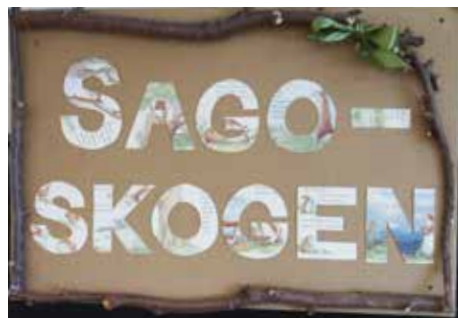
I läskuren Sagoskogen kan man läsa eller bara vila om man vill det.

Nytt på undervåningen är ett skötrum och tvättmöjligheter, så personalen slipper gå ut i hallen för att exempelvis byta en blöja.