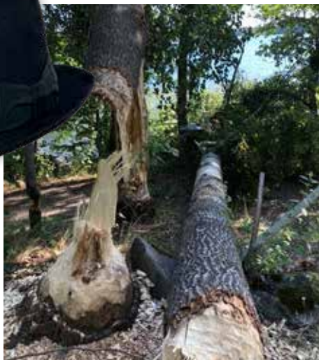
"Som han har kämpat Billy Bäver. Men till slut så... Röda spåret Adelsö."

Vid 1700-talets mitt beskrivs bävern som sällsynt förekommande i Sverige. Det fanns ett mindre bestånd i norra Sverige och förekomst noterades även kring Mälaren. 1756 publicerade Kungliga vetenskapsakademien en text för att begränsa jakten på bäver. Något skydd blev det inte. Istället tillkom en jaktlag 1808 som pekade ut bävern som ett rovdjur som gärna fick jagas. Under hela 1800-talet försvann de sista bävrarna i landskap efter landskap. 1871 anges som dödsår för den allra sista bävern i Sverige. 1873 blev bävern fridlyst i Sverige. Även om den inte var helt utrotad då, framstår det klart att det inte fanns tillräckligt många bävrar med närhet till varandra för att arten skulle överleva.