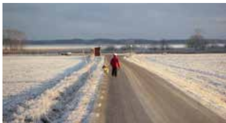
Gredby gata 2002.

Att nu busshållplatsen vid Gredby gata heter Lindbyvägen känns helt fel. Vi borde