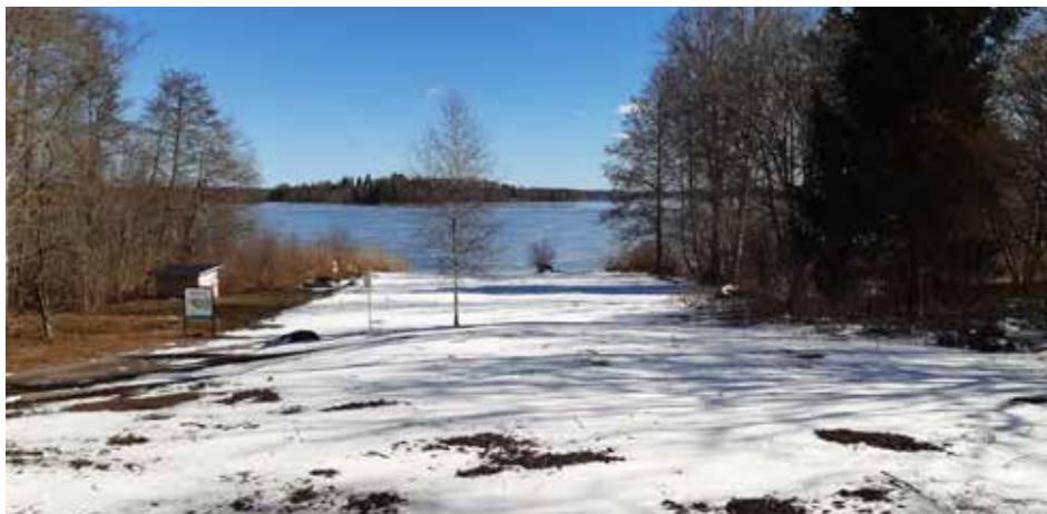
Den utfyllda slänten ned mot badplatsen en dag i mars. Till sommaren blir den så mycket mer lockande med gräs och ängsblommor – tack vare AIF.