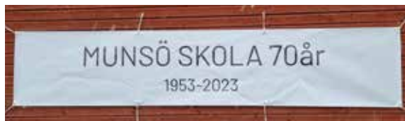
Munsö skola värd att fira! En banderoll på väggen, som syns för förbipasserande.

Munsö skola fyller 70 år i år och det firades på skolan onsdagen den 5 april med ett kalas.