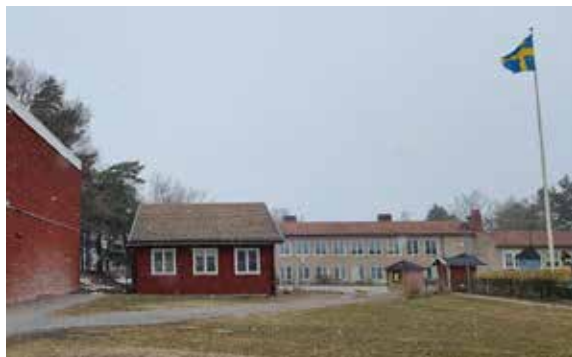
Flaggan är hissad för Munsö skola men snö och kyla satte stopp för utomhusfika.