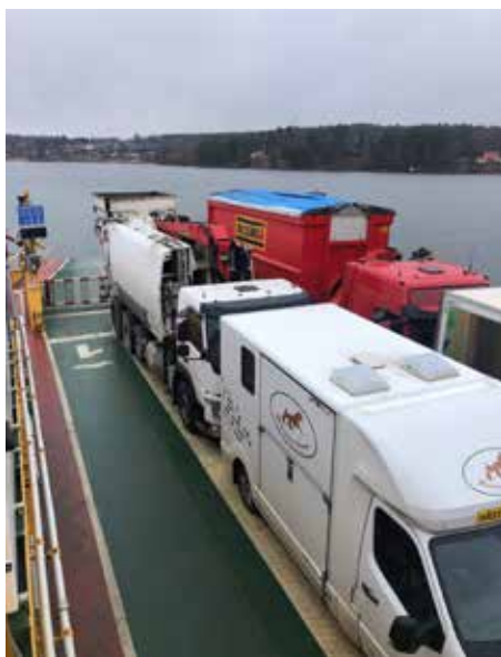
Utsikt från styrhytten.

Två grova stålvajrar och en befälhavare.