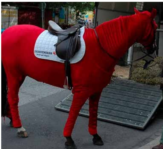
Rött helkroppstäck.

Solen hjälper din häst att hålla värmen. Till exempel en vinterdag, då det är kallt men sol och